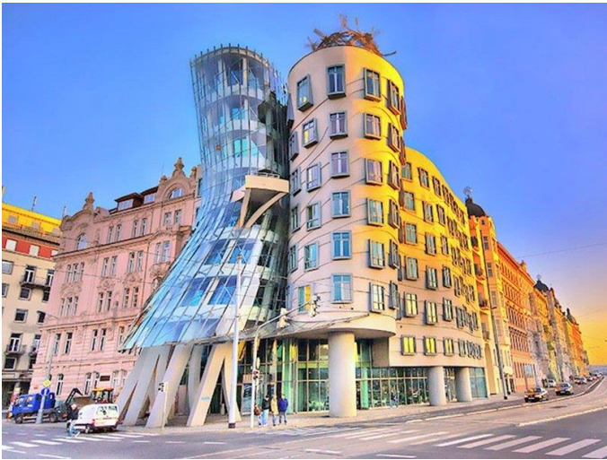
Танцующий дом в Праге.